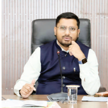
నిబంధనలు పద్మ అవార్డుల వెబ్సైట్: https://padmaawards.gov.in లో అందుబాటులో ఉన్నట్లు తెలిపారు. జిల్లాకు చెందిన అర్హులైన వ్యక్తులు లేదా వారి పేర్లను సిఫారసు చేయదలచిన వారు, పూర్తి వివరాలతో కూడిన ప్రతిపాదనలను 2026 జూలై 15లోగా జిల్లా సంక్షేమ అధికారి కార్యాలయానికి సమర్పించాలని కలెక్టర్ తెలిపారు.

లు, వైద్యం, సామాజిక సేవ, సైన్స్, ఇంజనీరింగ్, పబ్లిక్ అఫైర్స్, సివిల్ సర్వీస్, వాణిజ్యం, పరిశ్రమలు మొదలైన రంగాల్లో విశిష్ట సేవలు అందించి విజయాలు సాధించిన వారికి ఈ అవార్డులు అందజేయనున్నట్లు వెల్లడించారు. 2027 సంవత్సరానికి ఇచ్చే ఈ పద్మ అవార్డుల కోసం నామినేషన్లు, సిఫారసులను రాష్ట్రవారీ పురస్కార పోర్టల్ https://awards.gov.in ద్వారా స్వీకరించబడతాయని వెల్లడించారు. నామినేషన్లను 15 జూలై, 2026 లోగా పైన పేర్కొన్న పోర్టల్లో అందుబాటులో ఉన్న ఫార్మాట్లో, పూర్తి వివరాలతో పాటు విశిష్ట సేవలు, సామాజిక సేవలు వివరణాత్మక కథనం రూపంలో పంపించాలని తెలిపారు. ఆన్లైన్లో నామినేషన్లు పంపడానికి అవసరమైన సూచనలు https://awards.gov.in పోర్టల్లో అందుబాటులో ఉన్నాయని, అలాగే నియమ