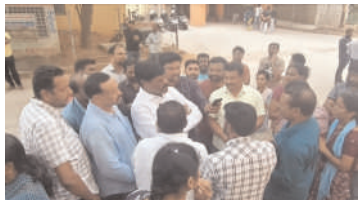
ఆత్మహత్య చేసుకున్న దంపతుల కుటుంబ సభ్యులకు పెద్ద పరామర్శ