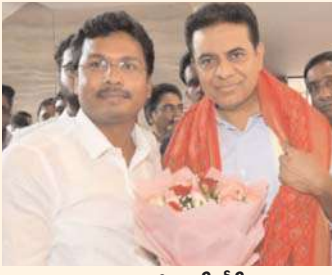
నామాపురం మాజీ ఎంపీటీసీ ఊరిపక్క