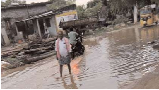
ప్రధాన రహదారిపై నీటి నిలువ సమస్యను పరిష్కరించండి

కోదాడ ఖీలా కు రేపాల ఉపసర్పంచ్ : తుమ్మ సతీష్ వివేక మునగాల జూలై 08 (జనంసాక్షి):