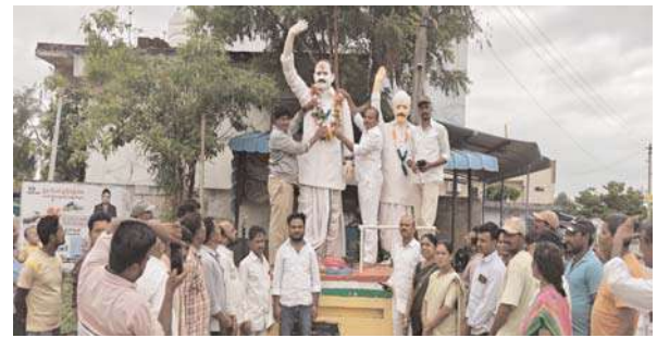
డాక్టర్ వైయస్ రాజశేఖర్ రెడ్డి 77వ జయంతి వేడుకలు