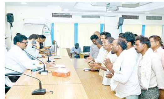
ప్రజావాణి ఫిర్యాదులు సత్వరం పరిష్కరించాలి: