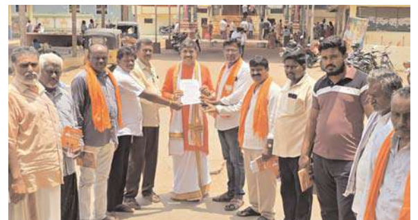
బీజేపీ నాయకుల కృషితో ఎర్రుపాలెం లో