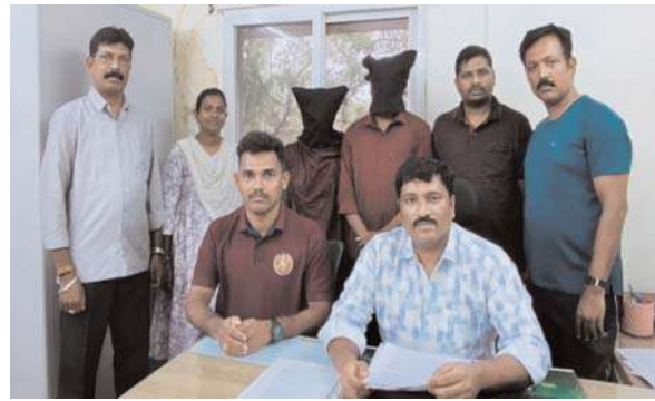
ఇద్దరు సైబర్ నేరస్తుల అరెస్టు