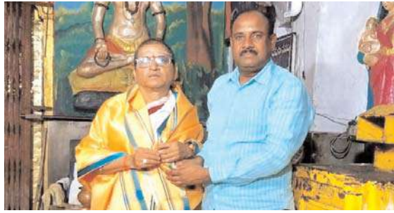
మాజీ పబ్లిక్ ప్రాసిక్యూటర్ నంద రమేష్