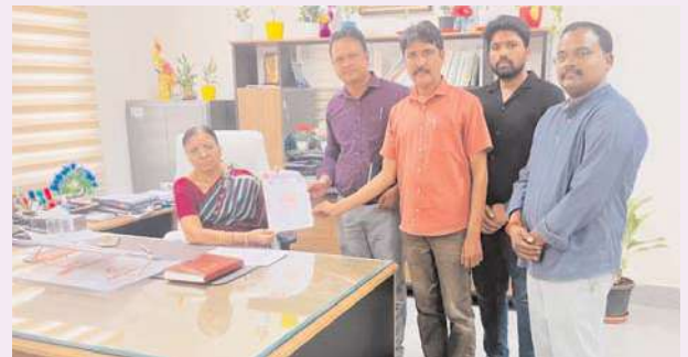
జనగణన లో పాల్గొన్న సూపర్వైజర్లకు, ఎన్యూమరేటర్లకు చెల్లించాలి