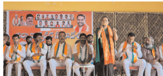
బలపడుతుందని ఆమె సూచించారు.