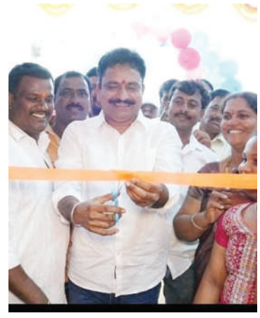
పాల్గొని స్టూడియో యాజమాన్యానికి శుభాకాంక్షలు తెలిపారు.