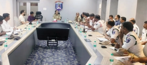
శేరిలింగంపల్లి, జూలై 8 (జనం సాక్షి): సైబరాబాద్ పోలీస్ కమిషనరీలో పరిధిలో ట్రాఫిక్ రద్దీని తాత్కాలికంగా విశ్లేషించి సమర్థవంతమైన నిర్వహణకు డేటా ఆధారిత కార్యపరణ రూపొందించాలని సైబరాబాద్ ట్రాఫిక్ విభాగం సంయుక్త కమిషనర్ సస్ ప్రీట్ సింగ్ అధికారులను ఆదేశించారు. శేరిలింగంపల్లి ట్రాఫిక్ జోన్ పరిధిలోని పోలీస్ స్టేషన్ స్టేషన్ చౌసా అధికారులతో బుధవారం కమిషనరీలో ప్రధాన కార్యాలయంలో నిర్వహించిన సమీక్షా సమావేశంలో ఆయన ట్రాఫిక్ నిర్వహణకు సంబంధించి పలు కీలక సూచనలు చేశారు. ప్రధానంగా పరిశ్రమలు, ఐటీ సంస్థలు, వాణిజ్య కేంద్రాల నుంచి ఏదీ సమయాల్లో ఎంత మేర వాహన రాకపోకలు జరుగుతున్నాయో అంతంపై వారం రోజుల పాటు సమగ్ర సర్వే నిర్వహించాలని సూచించారు. ప్రతిరోజూ సమయానుసారంగా వాహనాల లెక్కలు చేపట్టి ఉదయం, సాయంత్రం రద్దీ సమయాల్లో ట్రాఫిక్ తీవ్రతను అంచనా వేయాలని తెలిపారు. ఈ సర్వే ద్వారా భవిష్యత్ ట్రాఫిక్ ప్రణాళికకు అవసరమైన ఖచ్చితమైన సమాచారం అందుబాటులోకి వస్తుందని పేర్కొన్నారు. ఐటీ కార్పొరేట్ పనిచేసే ఉద్యోగులు వ్యక్తిగత వాహనాల వినియోగాన్ని తగ్గించి కార్పొరేట్, పేరింగ్ విధానాలను అనుసరించేలా అవగాహన కల్పించాలని సూచించారు. అలాగే వాహనాల వర్గీకరణ, ట్రాఫిక్