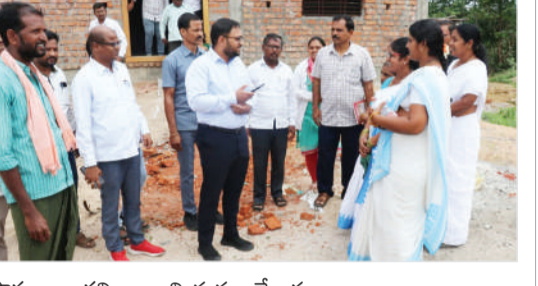
సౌకర్యాల కల్పించాలని స్పష్టం చేశారు.