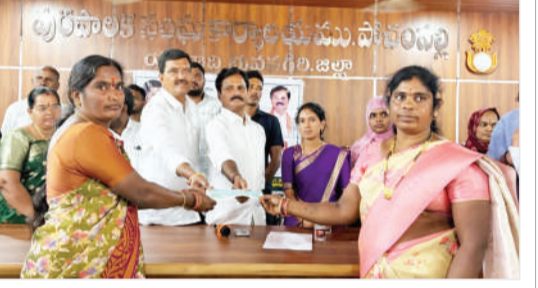
సకాలంలో అందేలా ప్రభుత్వం కట్టుబడి పనిచేస్తోందని పేర్కొన్నారు.