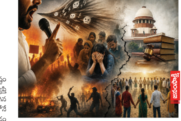
తీర్చి అబద్ధాల పర్వస్ యూనియన్ ఆఫ్ ఇండియా కేసులో ఎలాంటి ముందుస్థు ఫిర్యాదు లేకపోయినా పోలీసులు స్వయంగా (సుమోలో) కేసులు నమోదు చేయాలని ఆదేశించినప్పటికీ, ఆవరణలో ఆ ఉత్తర్వులు నత్తనడకనే సాగుతున్నాయి. ఈ నేపథ్యంలో, కర్ణాటక ప్రభుత్వం 2025లో ప్రత్యేకంగా హేట్ స్పీచ్ అండ్ హేట్ క్రిమినల్ ప్రొసెక్యూషన్ బిల్లును ప్రతిపాదించడం దేశంలోనే ఒక వివాదాస్పద ప్రయోగంగా నిలిచింది.

చట్టపరమైన రక్షణలు - అమలులో వైఫల్యాలు: భారత రాజ్యాంగంలోని అధికరణ 19(1)(g) పౌరులకు వాక్ స్వాతంత్ర్యాన్ని కల్పిస్తున్నప్పటికీ, అది నిరంకుశమైనది కాదు. దేశ సార్వభౌమత్వం, ప్రజా శాంతి, నైతికతను కాపాడటం కోసం అధికరణ 19(2) ద్వారా సహేతుకమైన అంక్షలను విధించే అధికారం ప్రభుత్వాలకు ఉంది. గతంలో ఉన్న ఐటీసీ సెక్షన్ 153A, 293A స్థానంలో అమల్లోకి వచ్చిన కొత్త భారతీయ న్యాయ సంహిత 2023 లోని సెక్షన్ 196 ప్రకారం మతం, జాతి, భాష, ప్రాంతం ఆధారంగా వైషమ్యాలను అంక్షలను విధించే నేరం. దీనికి గరిష్ఠంగా మూడేళ్ల జైలు శిక్ష, ఒకవేళ ఈ ప్రసంగాలు పూజా స్థలాల్లో జరిగితే ఐదేళ్ల వరకు కఠిన శిక్ష విధించే అవకాశం ఉంది. అయితే, చట్టాలు ఎంత కఠినంగా ఉన్నా క్షేత్రస్థాయిలో వాటి అమలు నామమాత్రంగానే సాగుతోంది. నేషనల్ క్రిమినల్ రికార్డ్ బ్యూరో గణాంకాల ప్రకారం, ఈ తరహా కేసుల్లో నిందితులకు శిక్ష పడే రేటు కేవలం 20.2 శాతం మాత్రమే. అలాగే ఐదు కేసుల్లో నాలుగు కేసులు చట్టపరమైన తార్కిక ముగింపులకు నోచుకోవడం లేదు. అత్యున్నత న్యాయస్థానం సుప్రీంకోర్టు ఇటీవల (2026 ఏప్రిల్) ఒక కీలక పిటిషన్‌ను విచారస్తూ, దేశంలో ద్వేష ప్రసంగాలు, పుకార్ల సమస్య పెరగడానికి చట్టాల కొరత కారణం కాదని, ఉన్న చట్టాలను సరిగ్గా అమలు చేయకపోవడమేనని నిర్వాహకులుగా స్పష్టం చేసింది. లా కమిషన్ 267వ నివేదిక సూచనల మేరకు కేంద్ర, రాష్ట్ర ప్రభుత్వాలకు చట్ట సవరణలు పరిశీలించవచ్చని పేర్కొంది. గతంలో