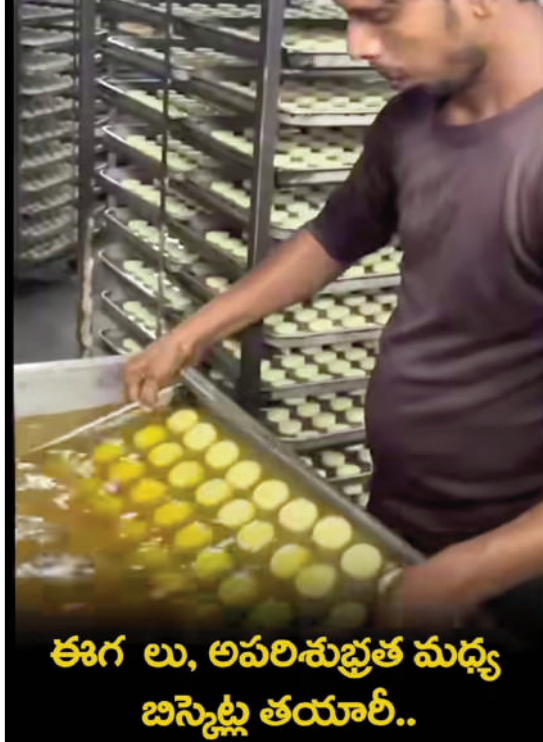
ఈగలు, అపరిశుభ్రత మధ్య బిస్కెట్ల తయారీ..

తీసుకోవడంతో పాటు మరోసారి తనిఖీలు నిర్వహిస్తామని ఆహార భద్రతా అధికారులు హెచ్చరించారు. అధికారులు చేపడుతున్న ఈ తరహా ఆకస్మిక తనిఖీలు ప్రజలకు సురక్షితమైన, నాణ్యమైన ఆహార ఉత్పత్తులు అందించడంలో కీలకంగా మారనున్నాయని పేర్కొన్నారు.