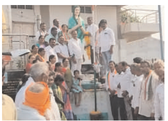
గోవిందరావుపేటలో కాంగ్రెస్ పార్టీ ఆధ్వర్యంలో..