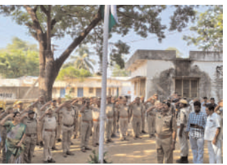
గూడూరు అటవీ కార్యాలయంలో..