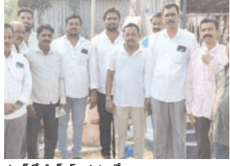
నెల్లూరులో జెండావిష్కరణ చేస్తున్న మాజీ ఎమ్మెల్యే..