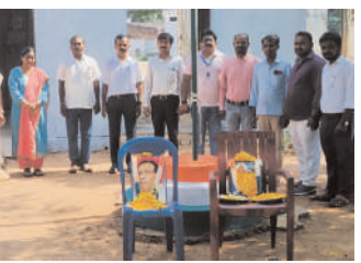
కురవి మండలం రాజోలు ఉన్నత పాఠశాలలో..