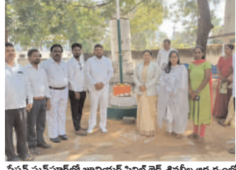
షేషన్ ఘనపూర్లో జూనియర్ సివిల్ జిల్డో శివరీతి ఆధ్వర్యంలో.. మల్లర్లో జిఆర్ఎస్ ఆధ్వర్యంలో..