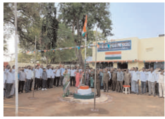
గూడూరు జిల్లా కార్యాలయంలో..