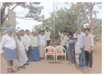
బజార్పాతూర్ మండలం దేగామ గ్రామంలో..