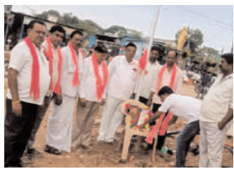
సారంగాపూర్లో జిఆర్ఎస్ ఆధ్వర్యంలో వేడుకలు