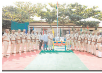
గోవిందరావుపేట : 5వ బెటాలియన్లో వేడుకలు