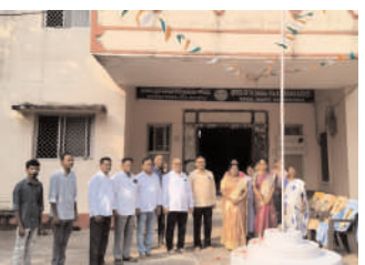
కాసిపేట ఎంపీడీవో కార్యాలయం వద్ద జెండావిష్కరణ