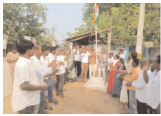
మహదేవాపూర్లో కాంగ్రెస్ పార్టీ ఆధ్వర్యంలో..