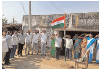
బీకుమట్ల, వెంకట్రావుపల్లి, పశు వైద్యశాలలో వేడుకలు