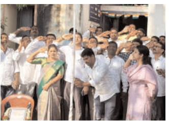
గూడూరు తహసీల్దార్ కార్యాలయంలో..