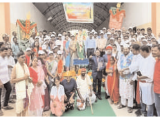
శ్రీరాంపూర్ ఏలయా పరిధి సేవాభవన్లో వేడుకలు