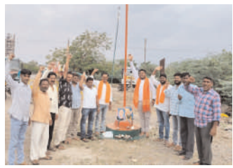
కాసిపేట మండలం దేవాపూర్లో జిజీఎస్ ఆధ్వర్యంలో వేడుకలు