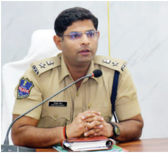
చర్యలకు పాల్పడితే సంబంధిత వ్యక్తులపై చట్టబద్ధ కఠిన చర్యలు తీసుకోవడం జరుగుతుందన్నారు.

నిరసనలు, ర్యాలీలు, పబ్లిక్ మీటింగ్లు, సభలు, సమావేశాలు నిర్వహించరాదని ఎస్పీ స్పష్టం చేశారు. శాంతి భద్రతలకు భంగం కలిగించే విధంగా, ప్రజాధనానికి నష్టం కలిగించే ఎలాంటి చట్టవిరుద్ధ కార్యకలాపాలు చేపట్టకూడదని హెచ్చరించారు. ఇట్టి విషయంలో జిల్లా ప్రజలు, ప్రజా ప్రతినిధులు, వివిధ సంఘాల నాయకులు పోలీసు వారికి సహకరించవలసిందిగా ఎస్పీ నూచించారు. అనుమతి లేకుండా పై