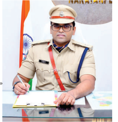
చేసుకునే అనుమతులు తీసుకోవాలని ఎస్పీ కోరారు.

నిర్వహించిన నిర్వాహకులపై చట్టపరమైన చర్యలు తప్పవని తెలిపారు. ప్రజా జీవనానికి ఇబ్బంది కలిగించేందుకు దారితీసే సమావేశాలు, జన సమాహం చేయడం పూర్తిగా నిషేధమని తెలిపారు. సోషల్ మీడియా నందు అనవసరమైన విషయాలను, మతాల మధ్య చిచ్చు పెట్టే అంశాలను వ్యాప్తి చేసిన వారిపై కేసులను నమోదు చేయబడతాయని తెలిపారు. చట్టపరంగా జారీచేసిన ఆదేశాలను ఎవరైనా ఉల్లంఘించినట్లయితే 30 పోలీస్ యాక్ట్ ప్రకారం శిక్ష అర్హులవ్వతారని తెలిపారు. నిషేధంలో ఉన్న నిబంధనలు తప్పనిసరిగా అందరూ పాటించాలని ఎలాంటి కార్యక్రమాలు నిర్వహించాలన్న ముందస్తు దరఖాస్తు