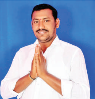
అనే లక్ష్యంతో పాఠశాల అభివృద్ధికి సహకరించిన ఎమ్మెల్యేకు గ్రామ ప్రజలు ఎల్లప్పుడూ రుణపడి ఉంటామని అన్నారు. అలాగే ఈ నిధుల మంజూరుకు సహకరించిన మండల నాయకులకు కూడా ప్రత్యేక ధన్యవాదాలు తెలిపారు.