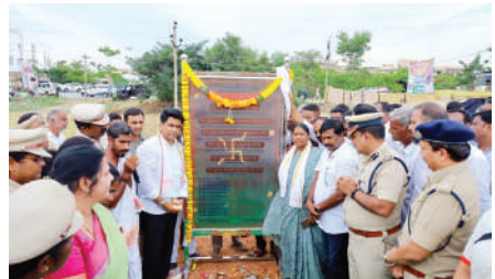
నాగర్ కర్నూల్, జూన్ 22 (జనంసాక్షి):

- నాగర్ కర్నూల్ లో భరోసా సెంటర్ కు శంకుస్థాపన చేసిన మంత్రి సీతక్క