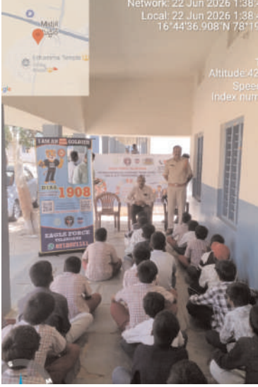
విద్యార్థులు పాల్గొన్నారు. అనంతరం డ్రగ్స్ కు వ్యతిరేకంగా విద్యార్థులచే ప్రతిజ్ఞ చేశారు.

రించారు. విద్యార్థి దశ నుంచే డ్రగ్స్ వంటి వ్యసనాలకు దూరంగా ఉండాలని పిలుపు నిచ్చారు. మాదకద్రవ్యాల రవాణా, విక్రయాలు లేదా వినియోగానికి సంబంధించిన ఎలాంటి సమాచారం ఉన్నా ప్రభుత్వం ఏర్పాటు చేసిన ప్రత్యేక టోల్ ఫ్రీ నెంబర్ 1908 కి లేదా ఈగిల్ ఫోర్స్ వాట్సాప్ నెంబర్ 871267 1111కి సమాచారం అందించాలని కోరారు. సమాచారం ఇచ్చిన వారి వివరాలు పూర్తిగా గోప్యంగా ఉంచబడుతాయని స్పష్టం చేశారు. ప్రతి విద్యార్థి ‘యాంటీ డ్రగ్ సోల్డర్’ (Anti-Drug Soldier) లా మారి సమాజంలో అవగాహన కల్పించాలని పిలుపునిచ్చారు. చదువుతో పాటు మంచి నడవడిక అలవర్చుకొని ఉన్నత శిఖరాలను అధిరోపించాలని ఆకాంక్షించారు. ఈ కార్యక్రమంలో పాఠశాల ఉపాధ్యాయులు, పోలీస్ సిబ్బంది విద్యార్థిని