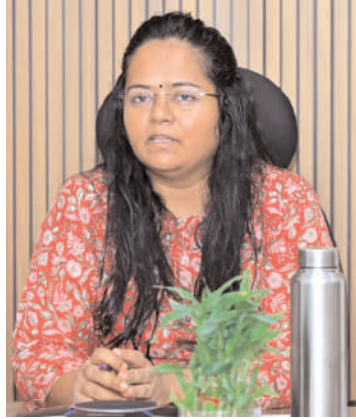
జూన్ 16, 2026 నాటికి ఓటర్ల తుది జాబితా ప్రకటన ఉంటుందన్నారు. డివిజన్, ఏఈఆర్ఓ స్థాయిలో కూడా శిక్షణ తరగతులు నిర్వహించాలని, ఎన్ఐఆర్ లో ఉన్న అన్ని మాడ్యూల్స్ పై బీఎల్ఓలు అవగాహన కలిగి ఉండాలన్నారు. చాలా జాగ్రత్తగా ఎక్కడ కూడా తప్పు జరగకుండా ఈ ప్రక్రియను చేపట్టాలని, ఈ ప్రక్రియపై విస్తృత ప్రచారం కల్పించాలని, జిల్లాకు మంచి పేరు తీసుకురావాలన్నారు.

జిల్లా కలెక్టర్ సూచించారు. భారత ఎన్నికల సంఘం జారీ చేసిన డిక్షరేషన్ ఫారాలను ప్రతి ఓటరుకు అందజేసి, వాటి స్వీకరణకు సంబంధించిన అంగీకార పత్రాన్ని (అక్నాలెడ్జ్మెంట్) తప్పనిసరిగా తీసుకోవాలని చెప్పారు. అర్హులైన ప్రతి ఓటరు వివరాలు ఓటరు జాబితాలో నమోదు అయ్యేలా చర్యలు తీసుకోవాలని, ఏ ఒక్క అర్హుడి ఓటు తొలగకుండా ప్రత్యేక శ్రద్ధ వహించాలని జిల్లా కలెక్టర్ ఆదేశించారు. ఎన్నికల కమిషన్ మార్గదర్శకాలను ఖచ్చితంగా పాటించి, ఎన్ఐఆర్ కార్యక్రమాన్ని విజయవంతం చేయాలని సూచించారు. జూన్ 25 నుంచి జూలై 24 వరకు బాత్ స్టాయి అధికారులు ఇంటింటికీ తిరిగి ఎన్యూమరేషన్ ఫారాలను పంపిణీ చేసి, ఓటర్ల వివరాలను సేకరిస్తారన్నారు. సేకరించిన సమాచారం ఆధారంగా జూలై 31న ముసాయిదా ఓటర్ల జాబితాను అధికారులు ప్రదర్శిస్తారన్నారు. జూలై 31 నుంచి ఆగస్టు 30 వరకు ముసాయిదా జాబితాపై అభ్యంతరాలు, పేర్ల తొలగింపు (లేదా) సవరణలకు దరఖాస్తు చేసుకోవచ్చు