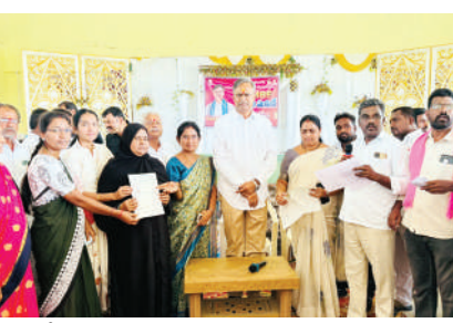
ఆరోగ్య సమస్యలు ఎదురైనప్పుడు ముందు గా ప్రభుత్వ ఆసుపత్రులను ఆశ్రయించాలని సూచించారు. అవసరమైన పరిస్థితుల్లో తమ నీలిమ హాస్పిటల్ సేవలను కూడా వినియోగించుకోవచ్చన్నారు. కార్యక్రమంలో ప్రజాప్రతినిధులు, పార్టీ నాయకులు లబ్ధిదారులు, ఉన్నారు.

అన్నారు. మంగళవారం చేర్యాల పట్టణ కేంద్రంలోని రేణుక గార్డెన్లో మంగళవారం నిర్వహించిన సీఎం ఆర్ఎఫ్ చెక్కుల పంపిణీ కార్యక్రమానికి ఆయన ముఖ్య అతిథిగా హాజరయ్యారు. చేర్యాల పట్టణంతో పాటు చేర్యాల, కొమురవెల్లి, మద్దూరు, దూలిమిట్ల మండలాలకు చెందిన లబ్ధిదారులకు రూ. 11 లక్షల 66 వేల విలువైన 55 సీఎంఆర్ఎఫ్ చెక్కులను ఎమ్మెల్యే గారు పంపిణీ చేశారు. ఈ సందర్భంగా ఎమ్మెల్యే పల్లా మాట్లాడుతూ.. రాష్ట్రంలోనే అత్యధిక సంఖ్యలో సీఎంఆర్ఎఫ్ చెక్కులను పంపిణీ చేసిన నియోజకవర్గంగా జనగామి అని పేర్కొన్నారు. ప్రజలకు అవసరమైన సమయంలో ఆర్థిక సహాయం అందించేందుకు ముఖ్యమంత్రి సహాయ నిధి ఎంతో ఉపయోగపడుతోందన్నారు. గ్రామీణ ప్రాంత ప్రజలు