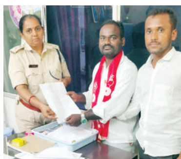
చేశారు. ప్రతి పాఠశాల బస్సులో ఫస్ట్ ఎయిడ్ బాక్స్, ఫైర్ ఎక్స్టింక్విషర్, సీసీ కెమెరాలు, జీపీఎస్ వ్యవస్థలు, అర్హత కలిగిన డ్రైవర్లు అటెండర్లు ఉండేలా చర్యలు చేపట్టాలని కోరారు.