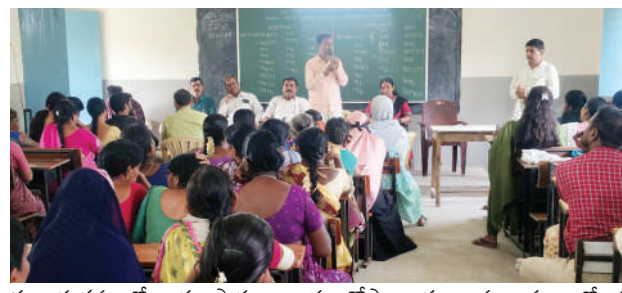
ఈ కార్యక్రమంలో ఆయా పాఠశాలల ప్రధానోపాధ్యాయులు మధ్యాహ్నం భోజన కార్యక్రమం పాల్గొన్నారు.

- మండల విద్యాధికారి వెన్ను శేఖర్ పెద్ద శంకరంపేట, జూన్ 15 (జనంసాక్షి): ప్రభుత్వ పాఠశాలలోని విద్యార్థులకు నాణ్యమైన మధ్యాహ్న భోజనం అందించాలని మండల విద్యాధికారి వి శేఖర్ అన్నారు. సోమవారం పెద్ద శంకరంపేట లోని మండల వనరుల కేంద్రంలో ఆయా పాఠశాలల ప్రధానోపాధ్యాయులతో మధ్యాహ్న భోజన కార్యక్రమంలో నిర్వహించిన సమావేశంలో ఆయన మాట్లాడారు. పాఠశాలలో మెనూ ప్రకారం విద్యార్థులకు నాణ్యమైన భోజనం అందించాలని సూచించారు. మధ్యాహ్నం భోజనానికి సంబంధించిన రికార్డులను సక్రమంగా నిర్వహించాలని. పాఠశాలలో పరిశుభ్రత తప్పనిసరిగా పాటించాలని ఆయన పేర్కొన్నారు.