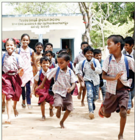
పిల్లలను సిద్ధం చేయడంలో జజ జజగా..

చిన్నారులు ఇప్పుడు మళ్ళీ తెల్లవారుజామున లేవాలి, యూనిఫాం ధరించాలి, పుస్తకాల బ్యాగు లు మోసుకోవాలి అన్న ఆలోచనతో కొంత మారం చేస్తున్నారు. ఇంకో వారం తర్వాత స్కూల్స్ వెళ్తాం, ఇంకా సెలవులు ఇవ్వాలి అంటూ తల్లిదండ్రులతో భూజుగింపులు మొదలుపెట్టారు. ముఖ్యంగా చిన్నతరగతుల విద్యార్థులు స్కూల్ ప్రారంభం అవుతున్నాయని వినగానే మారం చేస్తున్న దృశ్యాలు ఇక్కడ కనిపిస్తున్నాయి. మరోవైపు తల్లిదండ్రులు మాత్రం పిల్లలను కొత్త విద్యాసంవత్సరానికి సిద్ధం చేయడంలో బీజేగా మారారు. కొత్త పుస్తకాలు, నోట్ బుక్స్, బ్యాగులు, షూలు, యూనిఫాంల కొనుగోళ్లతో మార్కెట్లు సందడిగా మారాయి.