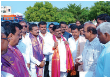
లకు అందజేయడం జరుగుతుందని తెలిపారు.

పటాన్వైరు, జూన్ 11 (జనంసాక్షి): పటాన్వైరు ప్రాంత అభివృద్ధి, వ్యాపార విస్తరణ, మరియు ఉపాధి అవకాశాల పెంపు లక్ష్యంగా పటాన్వైరు వ్యవసాయ మార్కెట్ సమగ్ర అభివృద్ధి కోసం ప్రణాళికలను రూపొందిస్తున్నట్లు పటాన్వైరు ఎమ్మెల్యే గూడెం మహిపాల్ రెడ్డి తెలిపారు. గురువారం పటాన్వైరు డివిజన్ పరిధిలోని వ్యవసాయ మార్కెట్ యార్డులో పర్యటించారు. యార్డు పరిధిలో చేపడుతున్న వివిధ అభివృద్ధి పనులను పరిశీలించారు. అనంతరం ఏర్పాటు చేసిన సమావేశంలో ఆయన మాట్లాడుతూ మాజీ ముఖ్యమంత్రి కేసీఆర్ నాయకత్వంలో వ్యవసాయ మార్కెట్ యార్డు ఏర్పాటు చేయడం జరిగిందని గుర్తు చేశారు. నాటి నుండి నేటి వరకు మార్కెట్ అభివృద్ధికి దశలవారీగా నిధులు కేటాయిస్తూ అభివృద్ధి పథంలో ముందుకు తీసుకొని వెళ్తున్నామని తెలిపారు. 20 కోట్ల 46 లక్షల రూపాయల అంచనా వ్యయంతో 172 దుకాణాలను నిర్మిస్తున్నట్లు తెలిపారు. నిర్దేశించిన గడువులోగా వీటిని పూర్తిచేసి లైసెన్స్ వ్యాపారస్తు