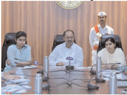
సమన్వయ సమావేశం నిర్వహించారు. ఈ సందర్భంగా ఎమ్మెల్యే మాట్లాడుతూ, పరకాల మహిళా డెయిరీని గొప్ప లక్ష్యంతో ఏర్పాటు చేస్తున్నామని తెలిపారు. పాల