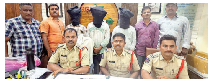
వార్త మెయిన్ లో