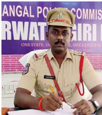
కేసులను లోక్ అదాలత్ లో పరిష్కరించుకోవాలని కోరారు.