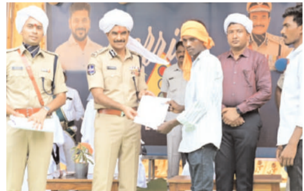
వార్త మెయిన్ లో