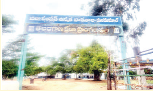
ప్రాధాన్యత ఉంటుందని పేర్కొన్నారు. అభ్యర్థులకు సంబంధించిన దరఖాస్తులను పరిశీలించి నారాయణపేట జిల్లా డి ఈ ఓ ఆఫీసుకు పంపించాము అని తెలిపారు.