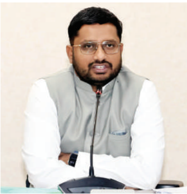
ఆధారంగా తగు చర్యలు తీసుకోవడం జరుగుతుందని ఈ సందర్భంగా జిల్లా కలెక్టర్ పేర్కొన్నారు.

ఫిర్యాదు చేసిన నేపథ్యంలో నిజానిజాలు తెలుసుకునేందుకు కలెక్టర్ ఆరుగురు సభ్యులతో కూడిన స్వతంత్ర విచారణ కమిటీని నియమిస్తూ ఆదివారం ఉత్తర్వులు జారీ చేశారు. మృతురాలికి సంబంధించిన కేసు షీట్, ట్రిబ్యూట్ నోట్స్, లేబోరేటరీ రిపోర్ట్స్, తదితర పరిశీలించి సమగ్రంగా విచారణ చేయాల్సిందిగా కలెక్టర్ సభ్యులను ఆదేశించారు. ఆసుపత్రి పర్యవేక్షకులు, సంబంధిత వైద్యాధికారులు విచారణకు పూర్తి సహకారం కమిటీ సభ్యులకు అందించాలన్నారు. కమిటీ సభ్యులకు సహకరించకుంటే సంబంధిత అధికారులపై నిబంధనల ప్రకారం తీవ్రమైన చర్యలు తీసుకుంటామని హెచ్చరించారు. కమిటీ విచారణ అనంతరం వచ్చిన నివేదిక