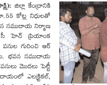
అలాగే బయట ఆవరణలో ప్లానిటేషన్, బ్యూటీఫికేషన్ ( సుందరీకరణ) పనుల కోసం ఆర్ అండ్ బి ఉన్నతాధికారుల నుంచి హెచ్ ఎం డి ఏ కు ప్రతిపాదనలు పంపించాలని, ఆయా పనులను వాళ్ళు చూసు కుంటారని కలెక్టర్ అధికారులకు సూచించారు. రివైజ్డ్ ప్రతిపాదనలు పంపించామనీ, నిధులు విడుదలలో జాప్యం ఉండదని, జూన్ నెలాఖరు వరకు పనులన్ని పూర్తి కావాలని ఆమె స్పష్టం చేశారు. ఈ కార్యక్రమంలో ఆర్ అండ్ బీ ఈ ఈ వెంకట రమణ, ఏ. ఈ, సిబ్బంది, కాంట్రాక్టర్ పాల్గొన్నారు.

నారాయణపేట, జిల్లా బ్యారో జూన్ 6 (జనంసాక్షి): జిల్లా కేంద్రానికి సమీపంలోని సింగారం మలుపు దారి వద్ద రూ.55 కోట్ల నిధులతో కొనసాగుతున్న నూతన కలెక్టరేట్ నమీకృత భవన సముదాయ నిర్మాణ పనులను శనివారం రాత్రి జిల్లా కలెక్టర్ సీ హెచ్ ప్రియాంక పరిశీలించారు. ఇప్పటి దాకా జరిగిన నిర్మాణ పనుల గురించి ఆర్ అండ్ బి అధికారులను అడిగి తెలుసుకున్నారు. భవన సముదాయ నిర్మాణ పనులతో పాటు బయట రోడ్లు, ఇతర పనులు మొదలు పెట్టి పూర్తి చేయాలని ఆదేశించారు. భవన సముదాయంలో ఎలక్ట్రికల్, ప్లంబింగ్, బయట డ్రైనేజీ పనులు ఎంత వరకు వచ్చాయని అడిగి తెలుసుకున్నారు. సోమవారం నుంచి 100 కు పైగా మనుషులను పురమాయించి మిగిలిన పనులన్నింటినీ వేగంగా పూర్తి చేయాలన్నారు. కలెక్టరేట్ లోపల భాగంలో ఇంటీరియర్ డిజైన్స్, మీటింగ్ హాల్ పెయింటింగ్ సుందరంగా ఉండాలన్నారు. జిల్లా అధికారుల చాంబర్స్ కోసం గ్లాస్ మాడిఫికేషన్ పనులను జాగ్రత్తగా చేయాలన్నారు. భవన సముదాయ ఆవరణలో సీసీ రోడ్ల నిర్మాణం చేపట్టాలని, మట్టి వర్షాకాలం ప్రారంభమైతే రోడ్లు వేయడం వీలు కాదన్నారు.