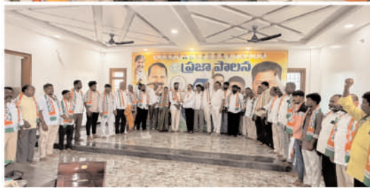
జగన్మోహన్ రెడ్డి పాల్గొన్నారు.