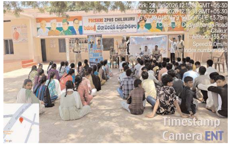
Timestamp Camera ENT