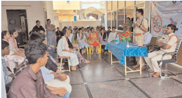
యువతపై మాదక ద్రవ్యాల దుష్ప్రభావం పడకుండా చూడాలి