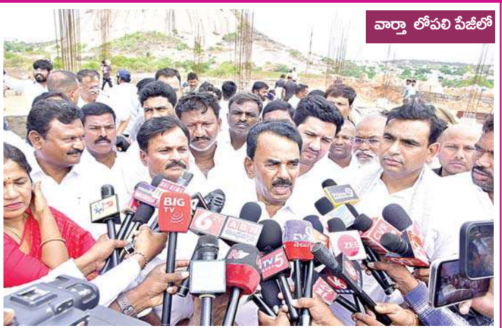
వార్తా లోపలి పేజీలో

స్వదేశీ దర్బార్ స్కీం 2.0 ద్వారా 56.81 కోట్లతో కోట అభివృద్ధి భువనగిరి కోటను ప్రపంచస్థాయి పర్యాటక కేంద్రంగా అభివృద్ధి చేస్తాం అక్టోబర్ నాటికి పనులు పూర్తి కావాలి: మంత్రి జూపల్లి కృష్ణారావు