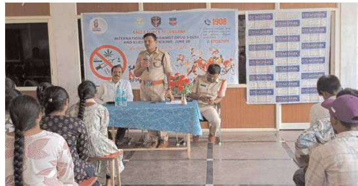
ఖమ్మంలో మాదక ద్రవ్యాల రహిత సమాజంపై