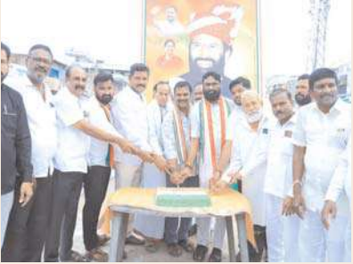
వారు మాట్లాడుతూ నియోజకవర్గంలో వేలకోట్ల