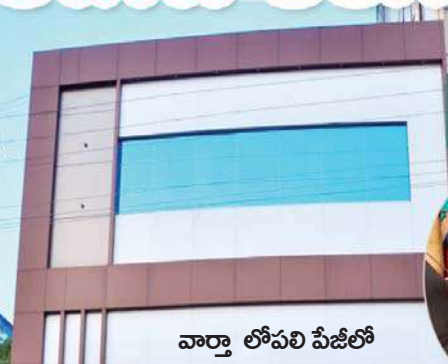
వార్తా లోపలి పేజీలో