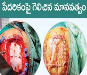
పేదరికంపై గెలిచిన మానవత్వం