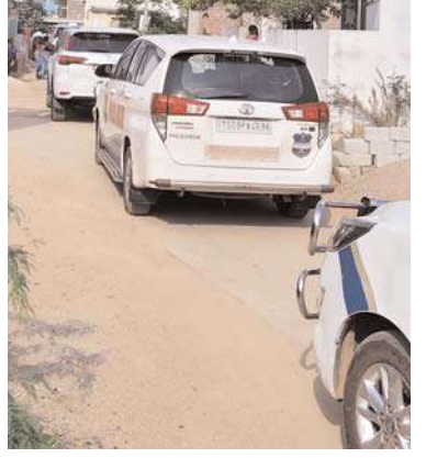
భాధ్యతాయుతమైన పదవిలో ఉన్న ఒక రాష్ట్ర మంత్రి ప్రజా నిబంధనలను బేఖాతరు చేస్తూ

మాడుగులపల్లి, జూన్ 10 (జనం సాక్షి): తెలంగాణ రాష్ట్ర సినిమాటోగ్రఫీ, రోడ్డు భవనాల శాఖ మంత్రి కోమటిరెడ్డి వెంకటరెడ్డి బుధవారం మాడుగులపల్లి మండలంలో జరిపిన పర్యటన చర్చనీయాంశంగా మారింది సాధారణంగా మంత్రుల పర్యటనల్లో భద్రతా వాహనాలు ఉండటం సహజమే అయినప్పటికీ, ఏకంగా 50 కార్ల భారీ కాన్వాయిత్తో ఆయన మండలానికి చేరుకోవడం స్థానికంగా విమర్శలకు దారి తీసింది దేశంలో ఇంధన పొదుపును ప్రోత్సహించాలని, పర్యావరణ పరిరక్షణకు ప్రతి ఒక్కరూ సహకరించాలని దేశ ప్రధానమంత్రి నరేంద్ర మోదీతో పాటు కేంద్ర, రాష్ట్ర ప్రభుత్వాల పెద్ద ఎత్తున ప్రచారం నిర్వహిస్తున్నాయి. సామాన్య ప్రజలు సైతం ఇంధన ధరల భారంతో పొదుపు మంత్రం పాటిస్తుంటే,