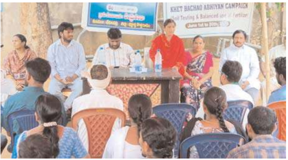
మట్టి పీఠిక- సమీతుల్య ఎరువుల వినియోగం పై అవగాహన