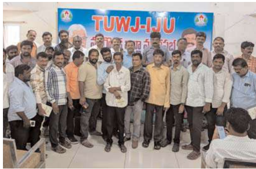
తెలంగాణ రాష్ట్ర వర్కింగ్ జర్నలిస్ట్ యూనియన్