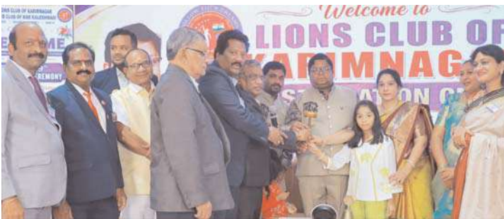
లయన్స్ క్లబ్ ఆఫ్ కరీంనగర్ నూతన కార్యవర్గ ప్రమాణ స్వీకారం