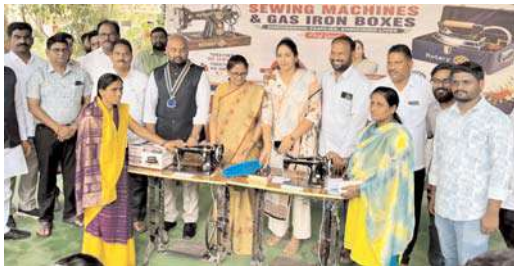
బోధన్ రోటరీ క్లబ్ ఆధ్వర్యంలో