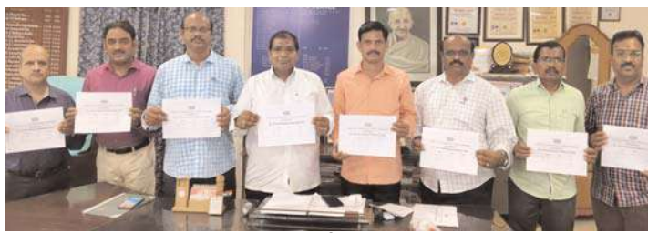
ఎస్ఆర్ఆర్ అటనామన్ కళాశాల డిగ్రీ ఆరవ సెమిస్టర్ ఫలితాలు విడుదల