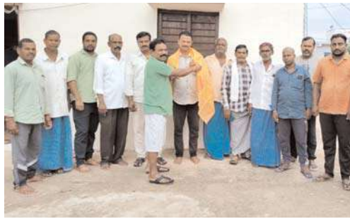
కార్యక్రమంలో గ్రామ పెద్దలు, యువజన ప్రతినిధులు, మహిళలు, ప్రజాప్రతినిధులు, కమిటీ సభ్యులు మరియు గ్రామస్తులు పాల్గొన్నారు.