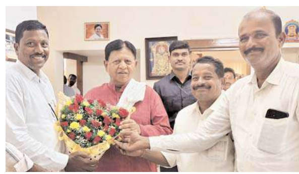
బోధన ఎమ్మెల్యే, ప్రభుత్వ సలహాదారును కలిసిన