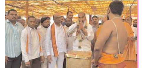
సూచనలతో అలయాల అభివృద్ధి చేపడుతున్నామని తెలిపారు.