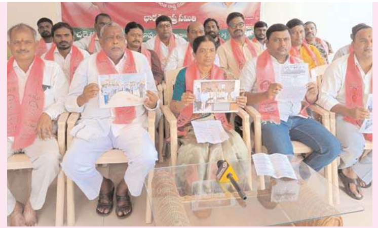
ట్రాక్ సీట్లు తిరిగి రాలేదన్నారు.