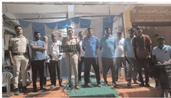
జగిత్యాల కళా బృందంతో..