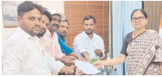
మదుమలాలాచ జూనియర్ కళాశాలకు సొంత భవన నిర్మించాలి