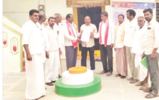
అన్ని రకాల ధాన్యం కొనాలి. కేంద్రం చెప్పిన మేరకే కొంటామంటూ రాష్ట్ర ప్రభుత్వం రైతులకు అన్యాయం చేస్తోంది.