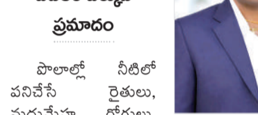
పొలాల్లో నీటిలో పనిచేసే రైతులు, మధుమేహ రోగులు, వృద్ధులు, కాళ్లలో వాపు ఉన్నవారు, వెరికోస్ వెయిస్ ఉన్నవారు, డిర్మటాలజీ మూత్రపిండ, కాలేయ లేదా గుండె వ్యాధిగ్రస్తులు, రోగినోరోధక శక్తి తక్కువగా ఉన్నవారికి ఎక్కువగా ప్రమాదముంటుంది.