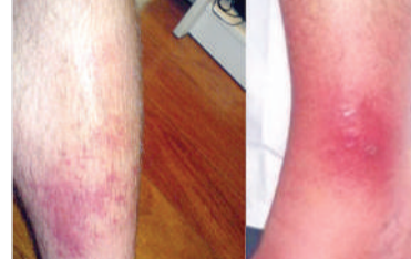
ఎవరికి ఎక్కువ ప్రమాదం