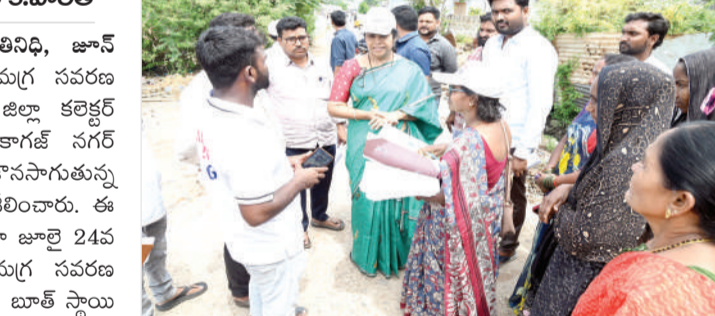
ఎన్యూమరేషన్ ఫారం అందించి బి ఎల్ ఓ యాన్ తో మార్పిడి కార్యక్రమంలో సహకారం అందించిన ఓటరుకు బాత్ స్నాయి అధికారులు, తిరిగి సంబంధిత ఓటరు నింపిన ఫారంలోని

కొమరం భీమ్ ఆసిఫాబాద్ జిల్లా పప్రతినిధి, జూన్ 28 (జనంసాక్షి): ఓటరు జాబితా ప్రత్యేక సమగ్ర సవరణ ప్రక్రియను సమర్థవంతంగా నిర్వహించాలని జిల్లా కలెక్టర్ కె.పాలత అన్నారు. ఆదివారం జిల్లాలోని కాగజ్ నగర్ మున్సిపల్ పరిధిలోని 1వ వార్డులో కొనసాగుతున్న నిర్వహణ ఫారాల పంపిణీ ప్రక్రియను పరిశీలించారు. ఈ సందర్భంగా జిల్లా అదనపు కలెక్టర్ మాట్లాడుతూ జూలై 24వ తేదీ వరకు జరగనున్న ప్రత్యేక ఓటర్ సమగ్ర సవరణ ప్రక్రియను జిల్లాలో సమర్థవంతంగా చేపట్టాలని, బాత్ స్నాయి అధికారులు, ఏజెంట్లు, నూపర్వైజర్లు, వాలంటీర్లకు కేటాయించిన విధులను బాధ్యతగా నిర్వహించాలని తెలిపారు. బాత్ స్నాయి అధికారులు ఇంటింటికి వెళ్లి సంబంధిత ఓటరుకు బాత్ స్నాయి అధికారులు, తిరిగి సంబంధిత ఓటరు నింపిన ఫారంలోని