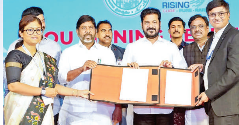
హైదరాబాద్ లో రవీంద్రభారతిలో జరిగిన కార్యక్రమంలో ఉద్యోగుల ప్రమాదబీమా పథకాన్ని ప్రారంభిస్తున్న ముఖ్యమంత్రి రేవంత్ రెడ్డి, చిత్రంలో డిప్యూటీ సీఎం భట్టి, మంత్రివివేక్, అధికారులు తదితరులు

హైదరాబాద్, జూన్ 25 (జనంసాక్షి): రాష్ట్ర ప్రభుత్వ ఉద్యోగుల సంక్షేమానికి మరో కీలక నిర్ణయం తీసుకున్నట్లు ముఖ్యమంత్రి రేవంత్ రెడ్డి ప్రకటించారు. ప్రభుత్వ ఉద్యోగులలో పాటు కాంట్రాక్ట్, అఫ్టర్ సర్వీస్ ఉద్యోగులందరికీ రూ. 1 కోటి ప్రమాద బీమా సదుపాయం కల్పిస్తున్నట్లు తెలిపారు. రాష్ట్రాన్ని అగ్రస్థానంలో నిలవడంలో ఉద్యోగులదే కీలకపాత్ర అని సీఎం పేర్కొన్నారు. ఉద్యోగుల భద్రత, వారి కుటుంబాల బాట సంక్షేమాన్ని దృష్టిలో ఉంచుకుని ఈ నిర్ణయం తీసుకున్నట్లు వెల్లడించారు.