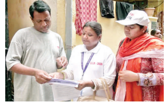
హైదరాబాద్ (జనంసాక్షి): తెలంగాణలో ఓటర్ల జాబితా ప్రత్యేక సమగ్ర సవరణ (ఎన్ ఐఆర్-సర్) సర్వే ప్రక్రియ గురువారం ప్రారంభమైంది. ఇవాళ్టి నుంచి జూలై 24 వరకు కొనసాగుతుంది. ఈ సందర్భంగా.. హిమాయత్ నగర్ వార్డు కార్యాలయంలో బీఎల్ ఓలకు ఎన్ ఐఆర్ సర్వే ఫారాలను అందించారు.