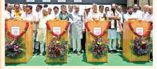
తుంగభద్ర డ్యాం గేట్లను ప్రారంభిస్తున్న కేంద్రమంత్రి పాటిల్, కర్ణాటక, ఏపీ, తెలంగాణ ముఖ్యమంత్రులు డి.కె. చంద్రబాబు, రేవంత్ రెడ్డి