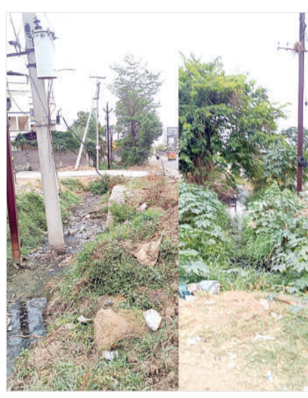
జంక్షన్ నుండి ఉరుసు బైపాస్ రోడ్డు వెళ్లే దారిలో వరద నీరు వల్ల కలిగే ఇబ్బందులను

సంబంధిత మున్సిపల్ అధికారులు పరిశీలించాలని, ఈ విషయంలో గతంలో జరిగిన ఇబ్బందులను గమనిస్తూ ఈసారి అలాంటి ఇబ్బందులు సమస్యలు రాకుండా ఉండేందుకు కచ్చితమైన స్థానిక కాలనీవాసులు, పలువురు వ్యాపారస్తులు కూడా డిమాండ్ చేస్తున్నారు. రంగసాయ పేటలోని, తెలంగాణ కాలనీ, లెన్స్ నగర్, సాయి నగర్ కాలనీ, వెంకటేశ్వర కాలనీ, వాటర్ ట్యాంక్ మొదలైన ప్రాంతాల నుండి వర్షాకాలంలో వరద నీరు ఉరుసు బైపాస్ రోడ్డుకు చేరి తీవ్ర అంతరాయానికి గురి చేస్తున్నట్లు చెప్పారు. ప్రధానంగా రోడ్డు పక్కన బాక్స్ డ్రెయిన్ లేదా కచ్చితమైన నిర్మాణాలు లేని అలా ఉన్నప్పుడే నీరు ఎక్కడ నిలవకుండా కాలువ ద్వారా నూనాయంగా వెళ్ళిపోతుందంటూ, కానీ కొందరు డ్రైన్ నిర్మించకుండా చిన్నచిన్న పైప్