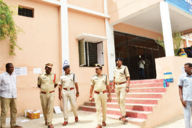
ఉండేందుకు ముందస్తుగా ప్రత్యేక ట్రాఫిక్ చర్యలు తీసుకుని, అదనపు సిబ్బందిని నియమించినట్లు చెప్పారు. పరీక్షలు ప్రశాంత వాతావరణంలో సజావుగా జరిగేలా పోలీసులు అన్ని చర్యలు చేపట్టారని తెలిపారు.

గద్వాల సడీగడ్డ, జూన్ 21 (జనం సాక్షి) : నీట్ పరీక్షల సందర్భంగా గద్వాల పట్టణంలోని ప్రభుత్వ బాండ్స్ హై స్కూల్, గన్నె హై స్కూల్, ప్రభుత్వ బాలికల జూనియర్ కళాశాలలో ఏర్పాటు చేసిన పరీక్షా కేంద్రాలను, అక్కడి భద్రత ఏర్పాటును జిల్లా ఎస్సీ డి. శ్రీనివాసరావు స్వయంగా పరిశీలించారు.