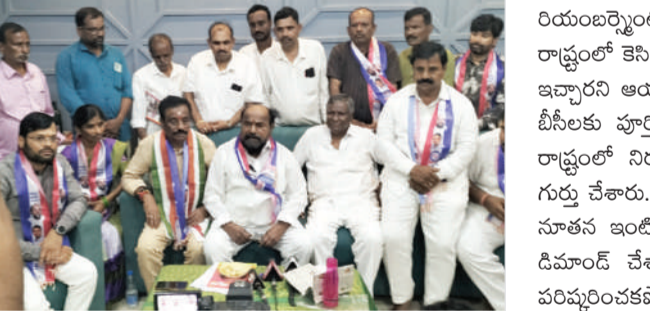
వచ్చిన తర్వాత ఫీజు రియంబర్స్ మెంట్ బకాయిలను రద్దు చేయాలని యోచనలో ఉందని అన్నారు జీవో నెంబర్ 8, 9 జీవోలను తీసుకొచ్చి బకాయిలను పూర్తిగా రద్దు చేసి యోచనలో ప్రభుత్వం ఉందని అన్నారు పాత జీవోను పునరుద్ధరించి,