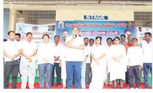
పేర్కొన్నారు. విద్యార్థులు వారిని స్పూర్తిగా తీసుకొని నిరంతరం వ్యాయామం చేస్తే శారీరకంగా, మానసికంగా దృఢంగా మారతారని, ఫలితంగా చదువులో చురుకుదనం పెరుగుతుందన్నారు.