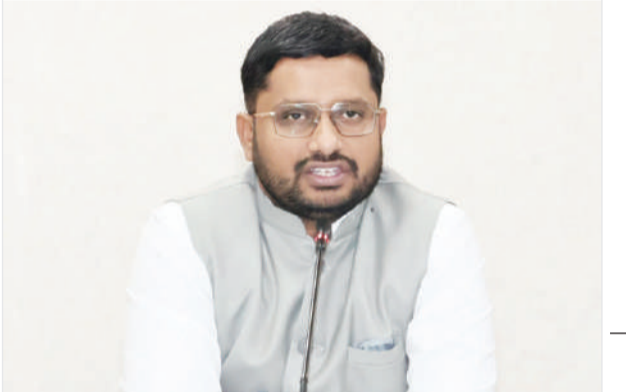
వేదికల్లో నాణ్యమైన విత్తనాలను అందుబాటులో ఉంచడమే ఈ మేకాల ప్రధాన ఉద్దేశమన్నారు. మేకాల వర్గ రైతులకు ఎలాంటి ఇబ్బందులు రాకుండా వ్యవసాయ శాఖ అధికారులు అవసరమైన ఏర్పాట్లు చేస్తారన్నారు.

గద్వాల సడీగడ్డ, జూన్ 21 (జనం సాక్షి) : రైతుల సంక్షేమాన్ని దృష్టిలో ఉంచుకొని ప్రభుత్వం ఈ నెల 23వ తేదీ నుంచి 30వ తేదీ వరకు ప్రతి మండలంలో విత్తన మేకాలను నిర్వహిస్తున్నందున అన్నదాతలు సద్వినియోగం చేసుకోవాలని జిల్లా కలెక్టర్ రిజిస్ట్రార్ బాషా షేక్ ఆదివారం ఒక ప్రకటనలో తెలిపారు.