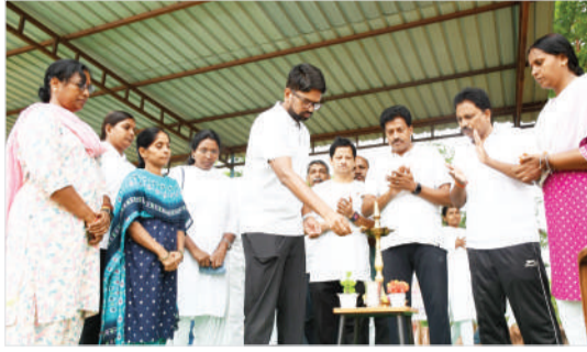
కాదని, ప్రతి ఒక్కరూ రోజూవారి జీవితంలో యోగా లేదా ఏదైనా శారీరక వ్యాయామాన్ని తప్పనిసరిగా భాగం చేసుకోవాలని సూచించారు.