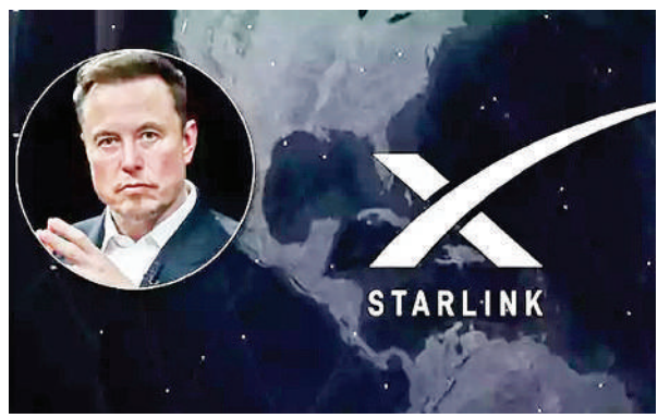
Elon Musk and Starlink logo.