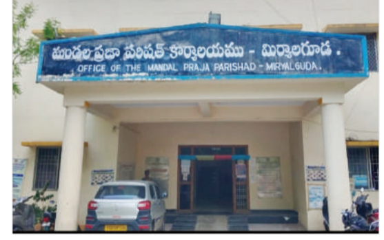
కావడం లేదు. అదేమిటని అధికారులను అడిగితే మాకు ఇంకా పైనుండి జీవో నే రాలేదు మాకు ఇంకా చెప్పలేదు అంటూ సమాధానం చెప్పారు.

చేయలేదు. ఇప్పుడు కాంగ్రెస్ ప్రభుత్వం ఏర్పడిన తరువాత నైనా కొత్త పెన్నన్ లు ఇస్తారేమో అని ఎదురు చూడక తప్పలేదు. చివరకు గత మార్చి లో బడ్జెట్ ప్రవేశ పెట్టిన సందర్భంలో స్వయానా ఆర్థిక మంత్రి భట్టి విక్రమార్కు ప్రకటించిన నేపథ్యంలో తెలంగాణ రాష్ట్ర ఆవిర్భావ దినోత్సవం సందర్భంగా జూన్ 2 నుండి కొత్త పెన్నన్లు అయింటుంటి వృద్ధాప్య మరియు వికలాంగులు, ఒంటరి మహిళల పెన్నన్ మంజూరు అవుతాయని ఆశతో ఉన్నారు. ప్రభుత్వం పెద్దలంతా సభల్లో సమావేశాల్లో ప్రకటించడం తో రాష్ట్ర వ్యాప్తంగా ఉన్న అర్బులైన నిరుపేదలంతా ఎంతో సంతోషపడ్డారు. ఆ రోజు నుండి మీ సేవ కేంద్రాలకు వద్దకు వెళ్లి అందుకు కావాల్సిన పత్రాలను, ఆదాయ ధ్రువీకరణ పత్రాలను సిద్ధం చేసుకోవాలి గ్రామ కార్యాలయాలకి దరఖాస్తులు ఇస్తున్నారు. ఇదే ఆయన గా భావించిన కొందరు గ్రామ కార్యదర్శులు ఇంటి వస్తు బకాయిలు మొత్తం చెల్లిస్తేనే దరఖాస్తులు తీసుకుంటామని కొర్రెలు పెట్టి ఇంటి వస్తులు వసూలు చేస్తున్నారు. ఇంత చేసిన చివరకు మండల పరిషత్ కార్యాలయాల్లో దరఖాస్తులు ఆన్లైన్ చేయడానికి సైట్ ఓపెన్