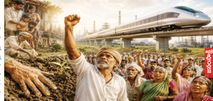
అలైన్మెంట్ రైల్ కారిడార్ అలైన్మెంట్ను జమీరాబాద్ మీదుగానే కొనసాగించాలని జమీరా బాద్ భూమిపుత్రులు నేడు ఉప్పెత్తున సమరశంఖం పూరించారు.

కన్నుల్ని లాంటి నల్లరేగడి మట్టిని సమృద్ధిగా పొందాలి. రేపటి తరం బాగుంటుందనే ఆశతో, తరతరాల ఎర్రమట్టి అనుబంధాన్ని తెంచుకొని సర్వస్వాన్ని ధారపోసిన గుండెలవి! సంచారం ముక్కులపుడున్నా భరిస్తూ, ఇల్లు వాకిలిని ఇండ్లవైపులో చాబ్ కోసం త్యాగం చేసిన చరిత్ర జమీరాబాద్ ప్రజలది. కానీ, నేడు ఆ త్యాగం పునాదులపై ఎదుగుతున్న పారిశ్రామిక సామ్రాజ్యంలో తాము పరాయి వాళ్లం కాకూడదని, ఆ బకపొత్తును బదులు రైతు నేడు బాధపడుతుంటున్నారని, అందుకే, ప్రతిపాదన ప్రైదరాబాద్ - ముంబై హైస్పీడ్ (బుల్లెట్) రైల్ కారిడార్ అలైన్మెంట్ను జమీరాబాద్ మీదుగానే కొనసాగించాలని జమీరా బాద్ భూమిపుత్రులు నేడు ఉప్పెత్తున సమరశంఖం పూరించారు.