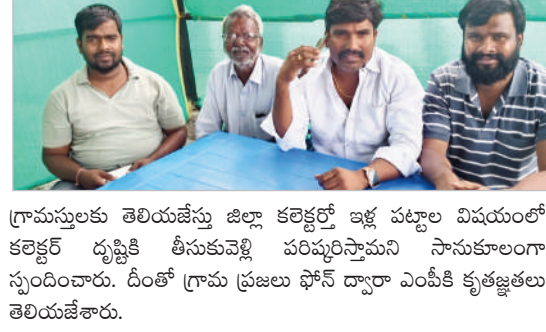
గ్రామస్థలకు తెలియజేస్తున్న జిల్లా కలెక్టర్తో ఇళ్ల పట్టాల విషయంలో కలెక్టర్ దృష్టికి తీసుకువెళ్లి పరిష్కరిస్తామని సానుకూలంగా స్పందించారు. దీంతో గ్రామ ప్రజలు ఫోన్ ద్వారా ఎంపీకి కృతజ్ఞతలు తెలియజేశారు.