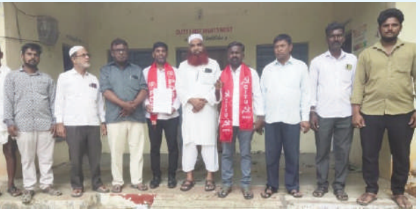
రూపాయల వరకు వసూలు చేస్తున్న పరిస్థితి నెలకొన్నదని కనీసం వీటికి బిల్లు కూడా ఇవ్వకుండా మోసం చేస్తున్నారని పేర్కొన్నారు.