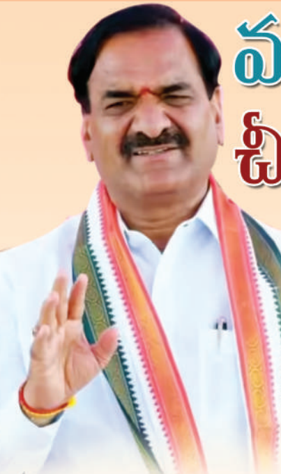
రంగారెడ్డి జిల్లా ప్రతినిధి (జనంసాక్షి)