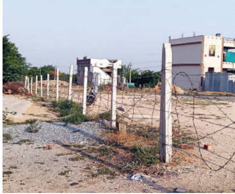
ఇప్పటికే వ్యవసాయ భూములుగానే దర్శనమిస్తున్నాయి. కానీ వెంచర్ నిర్మాణాలు తమ వద్ద అన్ని అనుమతులు ఉన్నాయని చెబుతుండడం గమనార్హం. అయితే భూభారతీ పోర్టల్ లో వ్యవసాయ భూములని చూపిస్తుండడం, నాలా కన్వర్షన్ కాకపోవడం అనుమానాలకు తావిస్తోంది. అయితే వెంచర్ నిర్మాణాలు నాలా కన్వర్షన్ చేసుకొని, వెంచర్ కు అనుమతులు తీసుకుని ఉంటే భూభారతీ పోర్టల్ లో వ్యవసాయ భూములని దర్శనమివ్వడం పై షాట్ల కొనుగోలు దారుల్లో అయోమయం నెలకొంది. ఇప్పటికైనా అక్రమ వెంచర్లపై చర్యలు తీసుకోవాల్సిన అవసరం ఎంతైనా ఉంది.

త్వానికి, ఇటు కొనుగోలుదారులకు ఇక్కట్లకు గురి చేస్తున్నారు. అనుమతులు లేకుండానే వెంచర్లు వేశారు. నాలా (నాన్ అగ్రికల్చర్ ల్యాండ్స్) అసెస్మెంట్ యాక్ట్)గా మార్చు కుండానే క్రయ విక్రయాలు సాగింది. వ్యవసాయ భూమిని వెంచర్ గా మార్చాలంటే మొదటగా నాలా కన్వర్షన్ చేయించి డీటీసీపీ అనుమతి తీసుకోవాల్సి ఉంటుంది. అనుమతులకు ప్రభుత్వానికి చలానా కట్టాల్సి వస్తుంది. ఇందుకోసం మార్కెట్ వాల్యూలో 6శాతం స్టాంప్, ద్యూటీ రూపంలో కట్టాల్సి ఉంటుంది. గ్రామ పంచాయతీకి 10శాతం భూమిని కేటాయించి రోడ్డు, డ్రైనేజీ, విద్యుత్ వ్యవస్థ, పార్కింగ్ ఏర్పాటు చేసి షాట్లను విక్రయించాలి. కానీ ఇవేమీ లేకుండానే కేటీడాడ్డి మండల కేంద్రం లో అడ్డగోలుగా అగ్రిమెంట్లతో ఇండ్ల నిర్మాణాల కోసం షాట్ల చేసి విక్రయించారు. కేటీడాడ్డి మండల కేంద్రంలో సర్వేనెంబర్ 9అ, 10 అ లలో ప్రభుత్వ నిబంధనలకు విరుద్ధంగా షాట్ల చేసి విక్రయాలకు పాల్పడుతున్నారు. ఇప్పటికీ నాలా కన్వర్షన్ తీసుకోలేదని సమాచారం. ఆయా సర్వే నెంబర్లలో ఉన్న భూమి భూభారతీ పోర్టల్