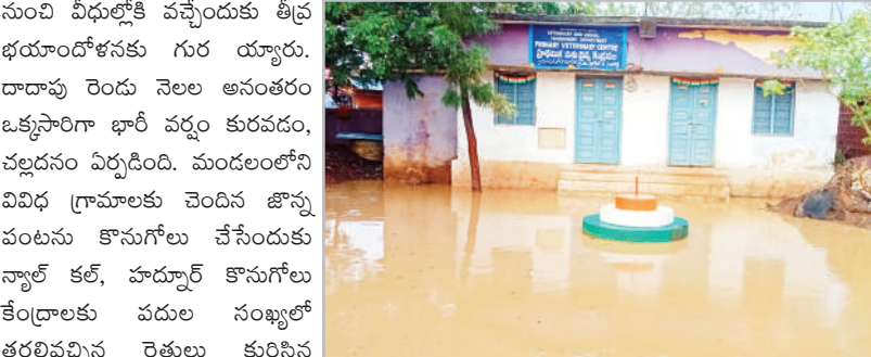
నుంచి వీధుల్లోకి వచ్చేందుకు తీవ్ర భయాందోళనకు గురయ్యారు. దాదాపు రెండు నెలల అనంతరం ఒక్కసారిగా భారీ వర్షం కురవడం, చల్లదనం ఏర్పడింది. మండలంలోని వివిధ గ్రామాలకు చెందిన జొన్న పంటను కొనుగోలు చేసేందుకు న్యూజ్ కల్, హద్దుర్ కొనుగోలు కేంద్రాలకు పదుల సంఖ్యలో తరలివచ్చిన రైతులు కురిసిన వర్షంతో తీవ్ర ఇబ్బందులకు గురయ్యారు. వందల కేంద్రాలకు తీసుకురావడంతో కురిసిన వర్షం కొనుగోలు కేంద్రాల వద్ద రైతులు, కేంద్రాల నిర్వహకులు ఒకింత ఇబ్బందులకు గురయ్యారు.