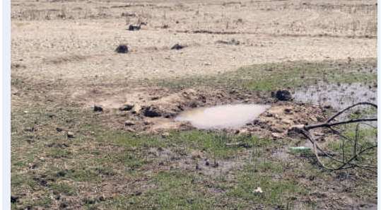
మెడక్ మే 5 (జనంసాక్షి) :