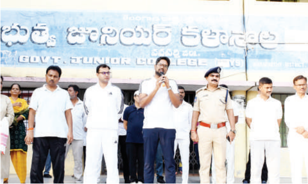
అధికారి తెలిపారు. యువతలో స్కిల్ డెవలప్ మెంట్, యూత్ పార్లమెంట్, స్వచ్ఛదనం, పచ్చదనం, వివిధ రంగాల్లో ముందంజలో ఉన్న యువతకు సన్మాన కార్యక్రమాలు వంటివి వారోత్సవాల రోజువారీ కార్యక్రమాల్లో భాగంగా