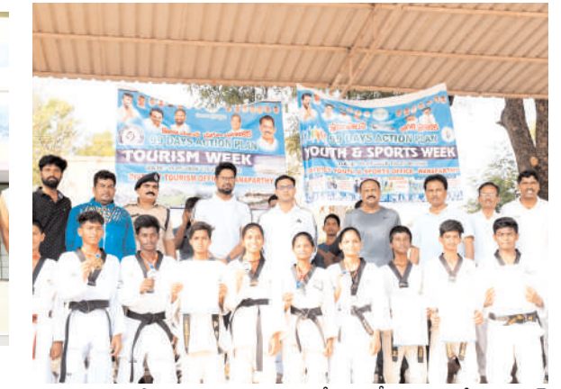
ఉంటాయని తెలిపారు. ఈ కార్యక్రమంలో డిఎస్పీ బాలాజీ నాయక్, అధికారులు, క్రీడాకారులు, విద్యార్థులు, యువత పెద్ద సంఖ్యలో పాల్గొన్నారు.