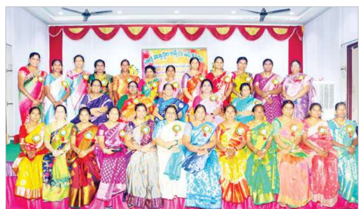
శాయంపేట ,మే 10 (జనం సాక్షి)శాయంపేట మండలంలోని జెడ్ పి ఎన్ ఎస్ బాలికల పాఠశాలకు సంబంధించిన 2001-2002 సంవత్సరానికి చెందిన పూర్వ విద్యార్థుల సమ్మేళనం వరంగల్ లోని కొత్త వాడ