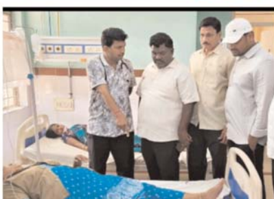
తెలిపారు. ఈ ఘటనలో ఎవరికి ప్రాణాపాయం లేదన్నారు. ప్రమాదానికి డ్రైవర్ అజాగ్రత్తతో పాటు