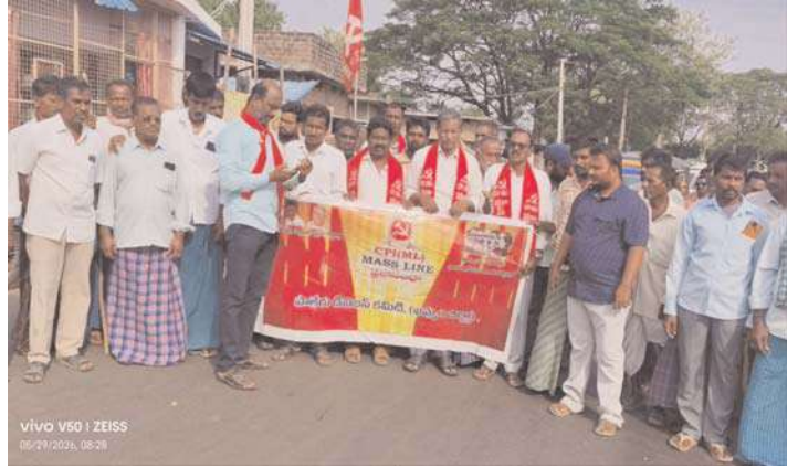
VIVO V50 | ZEISS 05/29/2025, 08:28