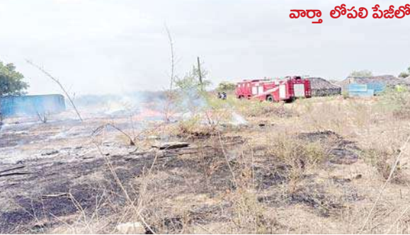
వార్తా లోపలి పేజీలో