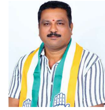
ఏర్పాటు చేసి సాఫీగా ధాన్యం కొనుగోలు చేస్తుందని తెలిపారు. మిగతా 2లో

వీరేశం ఎప్పటికప్పుడు నియోజకవర్గంలోని వద్ద కొనుగోలు కేంద్రాలను సందర్శించి కొనుగోలు ప్రక్రియ, రైతులకు అందుతున్న సౌకర్యాలు, ధాన్యం తరలింపు పరిస్థితులను అధికారులతో కలిసి క్షుణ్ణంగా పరిశీలిస్తున్నారని తెలిపారు. రైతుల సమస్యలను ఎప్పటికప్పుడు అడిగి తెలుసుకుని అధికారులకు తెలియజేసి సమస్యను పరిష్కరిస్తున్నారని పేర్కొన్నారు. ముఖ్యమంత్రి రేవంత్ రెడ్డి ఆధ్వర్యంలోని కాంగ్రెస్ ప్రభుత్వం రైతుల ఖాతాల్లో 48 గంటలలోనే దబ్బులు జమ చేస్తుందని తెలియజేశారు. మండలంలోని ఏ గ్రామంలో లేనిది ఇంద్రపాలనగరం గ్రామంలో రాస్తారోకోలు, ధర్నాల పేరుతో ఎందుకు అలజడులు సృష్టిస్తున్నారని మండల ప్రజలు గ్రహించాలని కోరారు. ఐకేపీ, పిఎస్ఎస్ ఆధ్వర్యంలో రెండు కొనుగోలు కేంద్రాలను